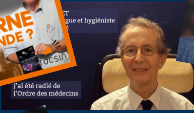
J'ai été radié de l'Ordre des médecins