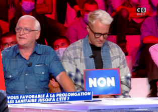
VOUS FAVORABLE À LA PROLONGATION DES SAMTAINS JUSQU'À L'ÉTÉ ?